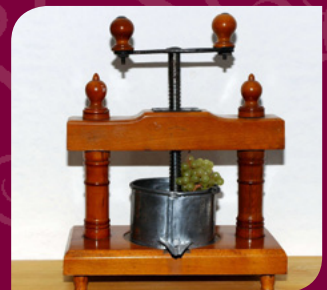
Pressoir de ménage 1900

Tél. musée : 02 51 41 39 01 - Tél. mairie : 02 51 41 48 48