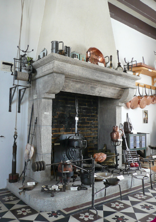
Cheminée avec tournebroche d'époque Louis XIV

Bienvenue au premier Musée de France consacré aux Ustensiles de Cuisine Anciens et à leur évolution à travers le temps.