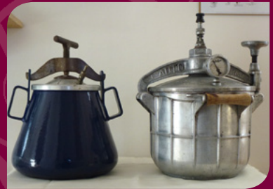
Collection d'autocuiseurs de 1920 à 1960

Vous découvrirez 1 500 objets répartis sur six salles d'exposition avec des thèmes différents tels que : la pâtisserie, la conservation, et, qui vous séduiront par leur diversité.