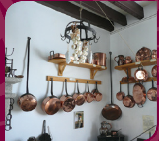
Coin cuivres XIX e et XX e

Vous découvrirez 1 500 objets répartis sur six salles d'exposition avec des thèmes différents tels que : la pâtisserie, la conservation, et, qui vous séduiront par leur diversité.